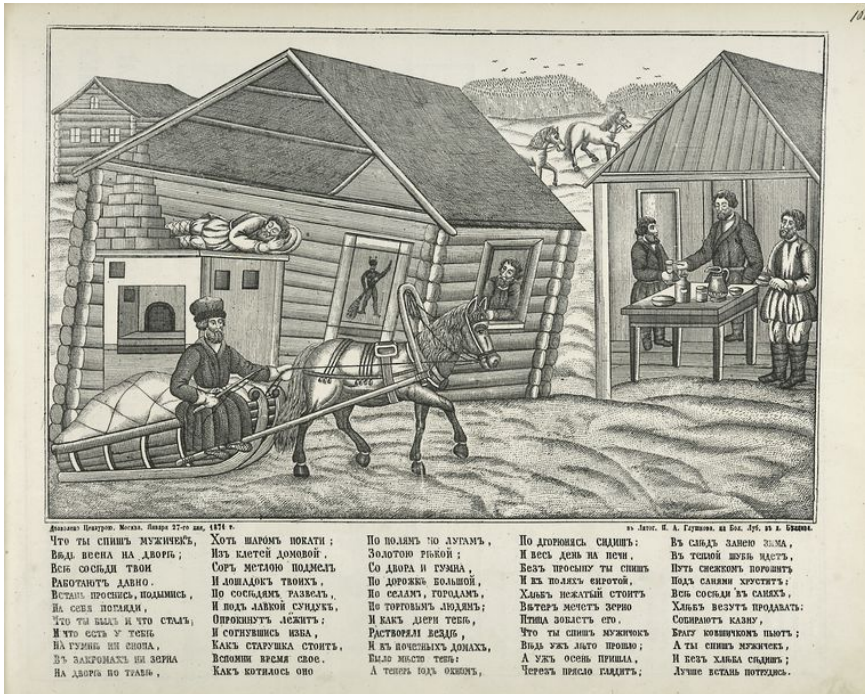
Рис. 1. Лубок «Что ты спишь мужичок» (1871)

мужичок, / И без хлеба сидишь / Лучше встань потрудись», — которое сводит на нет неоднозначность и метафизичность кольцовского стихотворения.